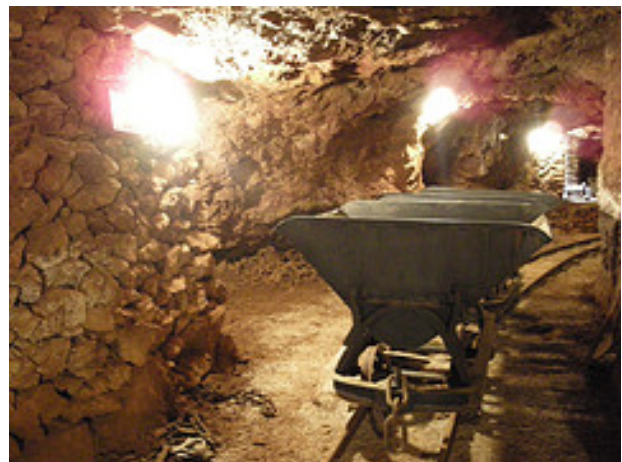
Interior museo de las minas