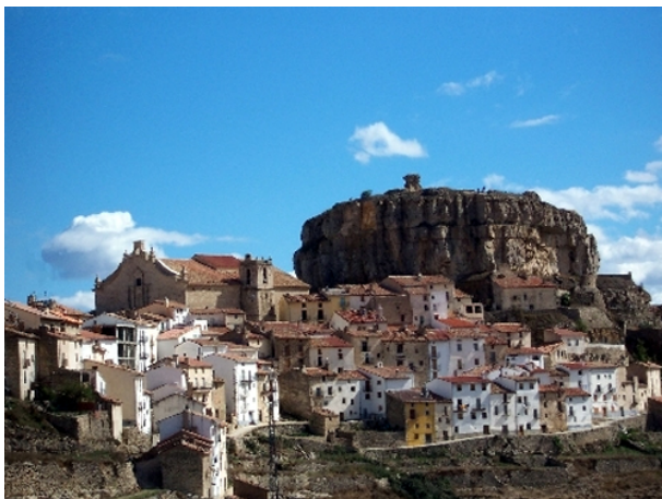
Minas de Culla y Torre d'En Besora

En su momento ya os informaremos del programa y precio.