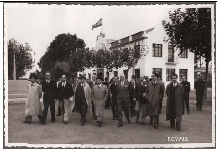
Foto: Inauguración de la Escuela de Aprendices de 1942

Os notificamos que las fechas previstas para la celebración del Centenario son del 16 al 26 de Noviembre.